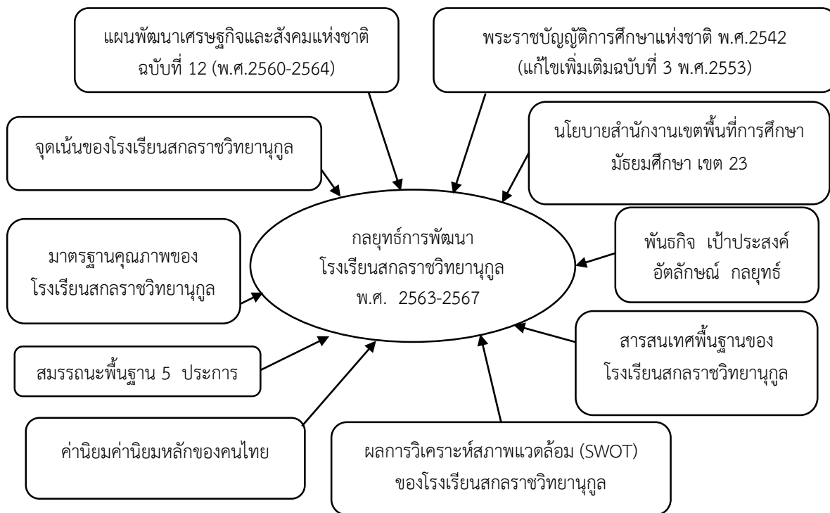
ภาพที่ 3 กรอบแนวคิดการจัดทำแผนกลยุทธ์การพัฒนาโรงเรียนสกลราชวิทยานุกูล